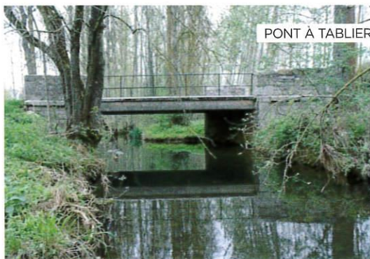
PONT À TABLIER