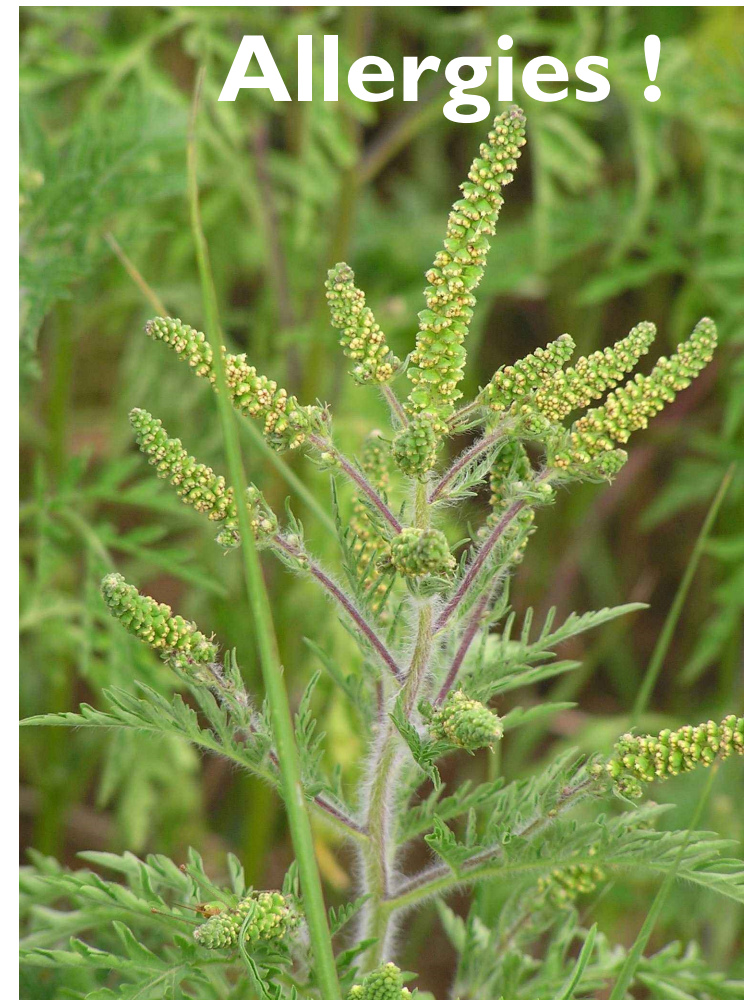
AMBROISIE À FEUILLES D'ARMOISE